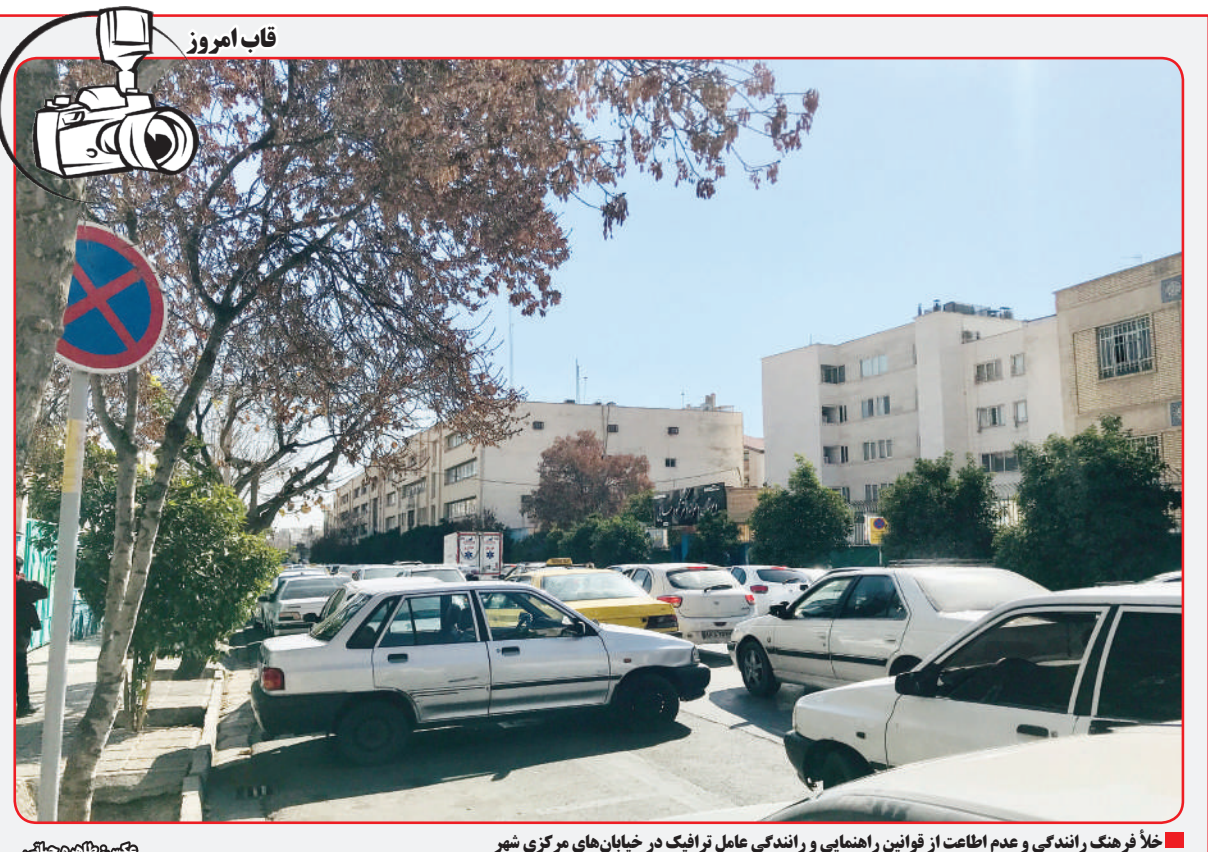
خلأ فرهنگ راندگی و عدم اطاعت از قوانین راهنمایی و راندگی عامل تراکم در خیابان‌های مرکزی شهر

نخستین اجرای موسیقی عمومی در ایران در باغی نزدیک حومه شهر تهران که آن زمان باغ بهجت‌آباد نامیده می‌شد و به مناسبت تولد حضرت علی (ع) توسط انجمن اخوت به همت درویش‌خان و عارف قزوینی برپا شد.