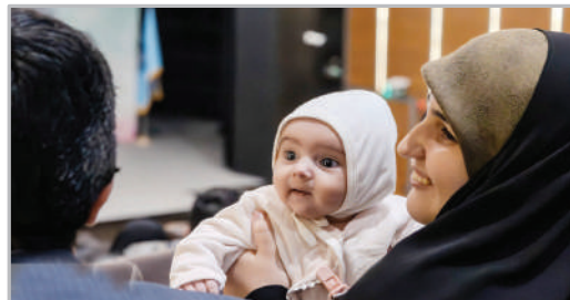
تجلیل از دانشجویان متأهل دانشگاه علم و صنعت