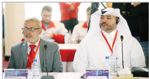
کنفرانس بین‌المللی حمایت از فلسطین