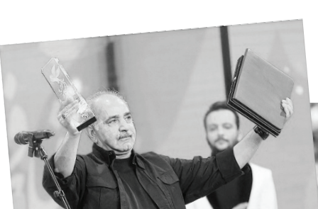
جشنواره فیلم فجر در سال ۱۳۶۱ برگزار و به نوعی جایگزین جشنواره فیلم تهران شد. جشنواره‌ای که از اولین دوره‌اش دغدغه فیلم انقلاب اسلامی را داشت.