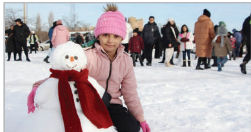
چشواره آدم‌برفی - اردبیل