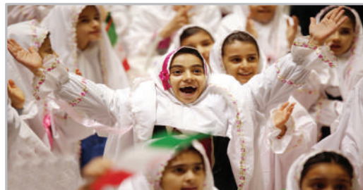
جشن تکلیف فرشته‌های کُرد ایرانی